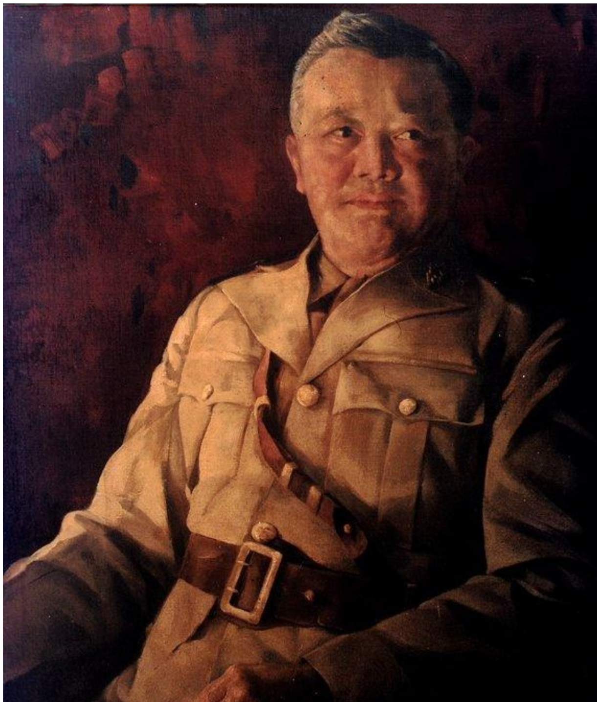
文森特·利姆，也叫文森特·林 Vicente Lim

文森特 利姆 (Vicente Lim)，生于1888年2月24日，死于1944年12月31日。他是第二次世界大战期间的菲律宾准将和民族英雄。