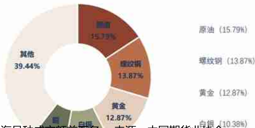
3月上海品种成交额前五名。

具体来看，上期所月成交量为196.04百万手，占全国市场的27.06%，同比增长11.69%，环比增长29.26%；上期能源月成交量为13.16百万手，占全国市场的1.82%，同比增长13.61%，环比增长45.18%；郑商所月成交量为305.79百万手，占全国市场的42.21%，同比增长46.14%，环比增长41.15%；中金所月成交量为14.20百万手，占全国市场的1.96%，环比增长4.79%。大商所月成交量为193.88百万手，占全国市场的26.76%，环比增长30.17%；广期所月成交量为1.38百万手，占全国市场的0.19%，环比增长36.88%。