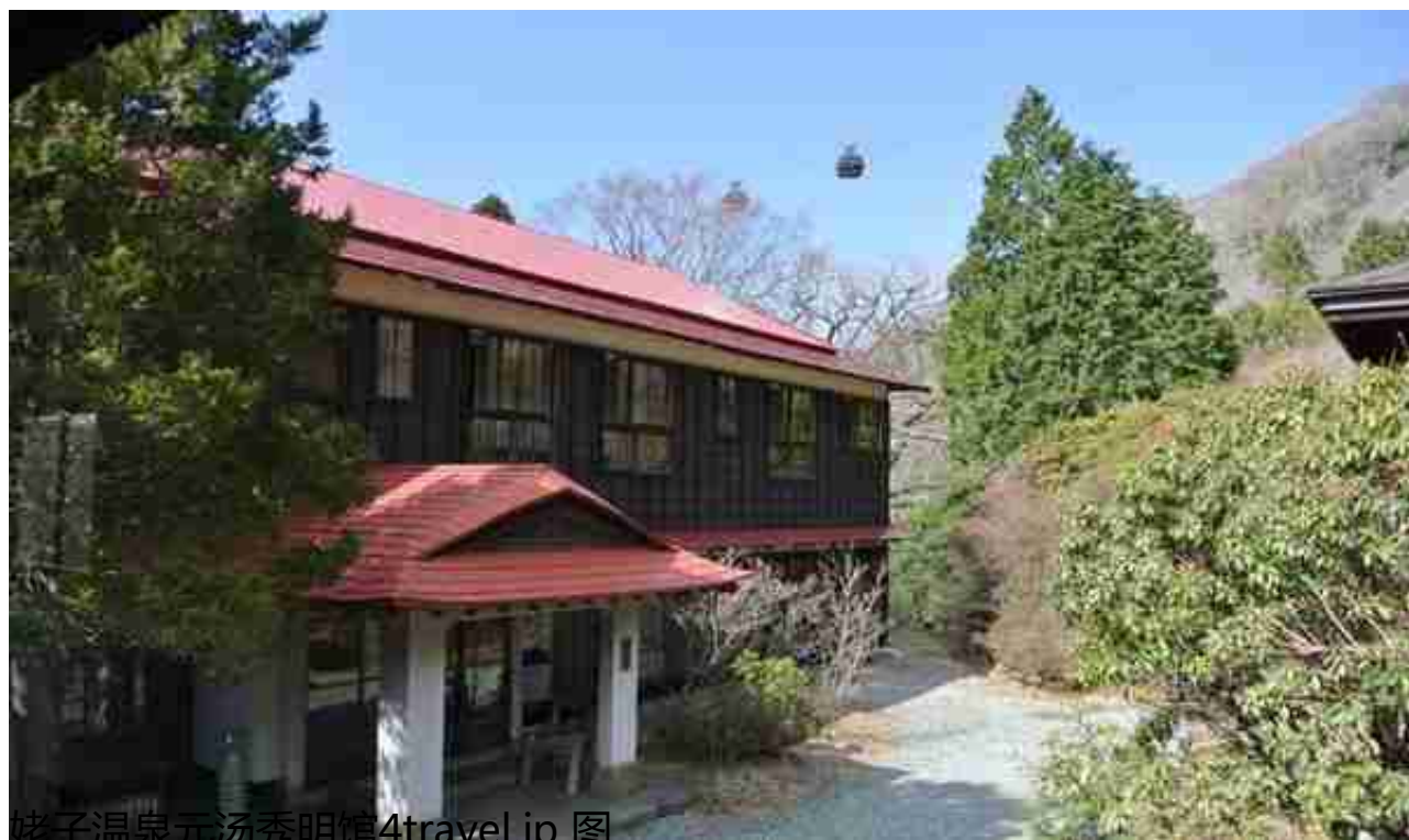
姥子温泉元汤秀明馆

然而，根据下到温泉中得见“谷底”这一点，可以确定梦窗疏石在停留期间曾到访谷底的堂岛温泉。江户时代后期出版的《七汤风趣》中介绍说，谷底的堂岛温泉有梦窗疏石的草庵遗迹，那么，梦窗疏石到访堂岛温泉，作和歌并入浴的可能性极大。