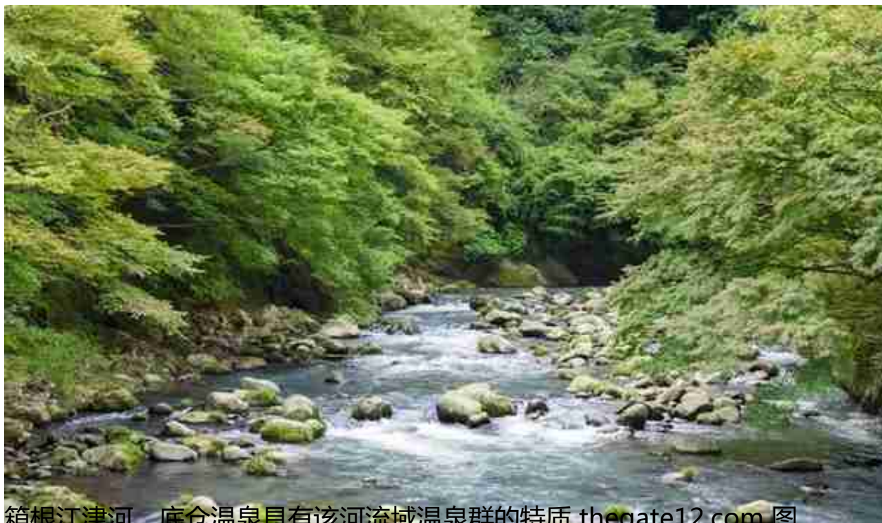
箱根江津河，底仓温泉具有该河流域温泉群的特质