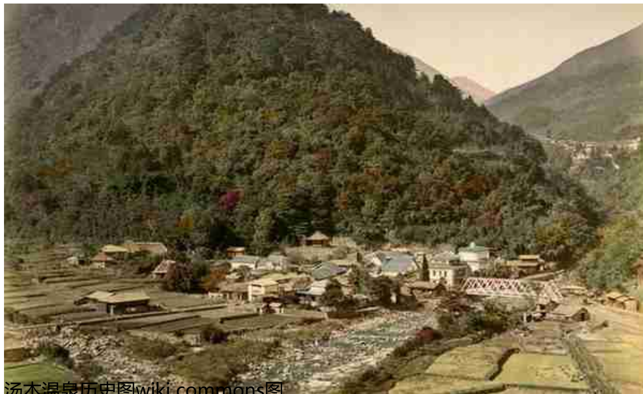
汤本温泉历史图

客人中还有前来温泉疗养。箱根史学者岩崎宗纯根据传为镰仓后期武将的金泽贞将在一封书信中有“为治病疗养，前去汤本”一句，指出汤本在镰仓时代已经具备了温泉疗养场所的功能。