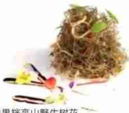
百香果拌高山野生树花