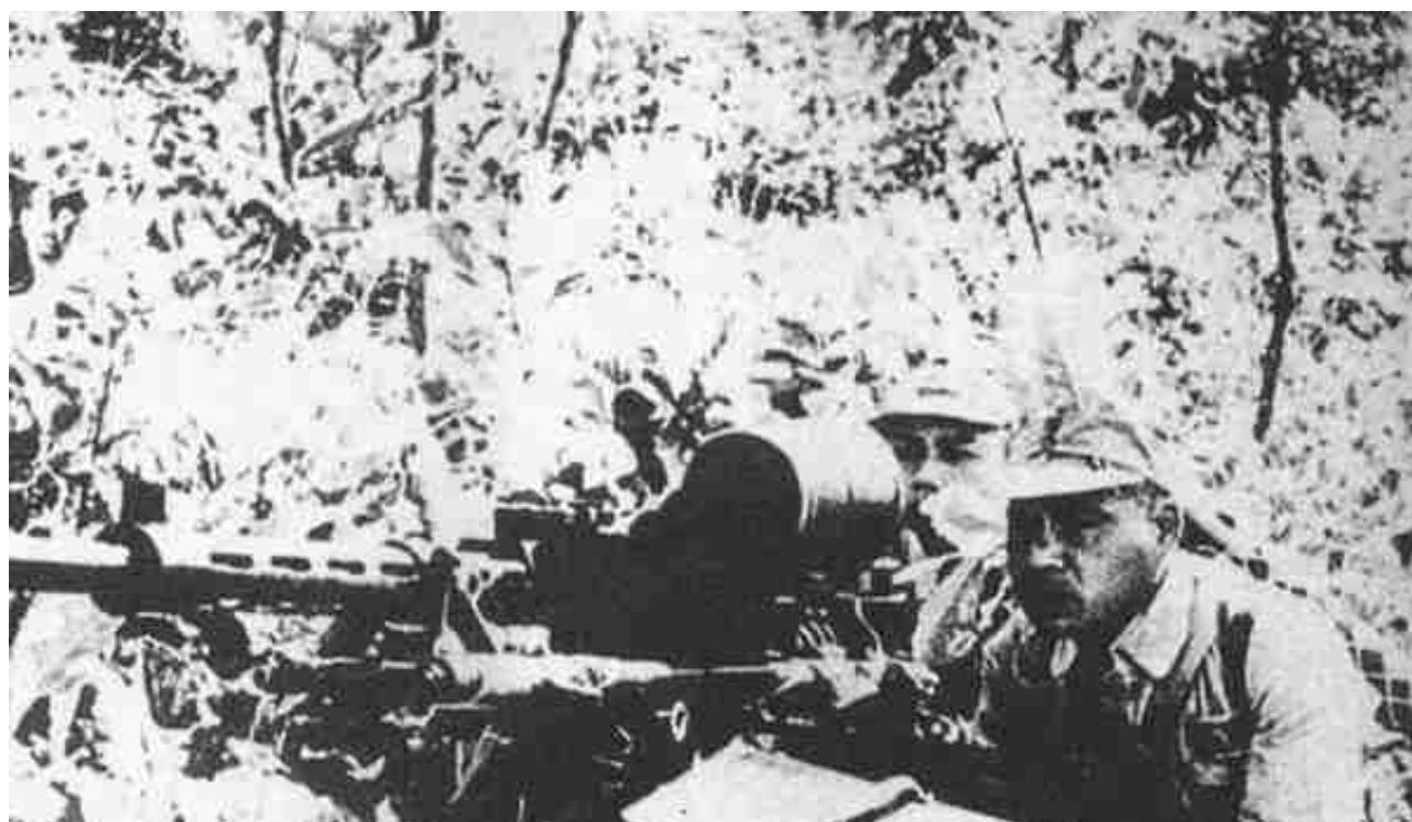
上图_ 中国远征军在缅甸密林中向日军发起攻击

能到中美两国著名政要和将领的赞扬，戴安澜将军对中国抗战和世界反法西斯战争做出重大贡献是彪炳史册的。